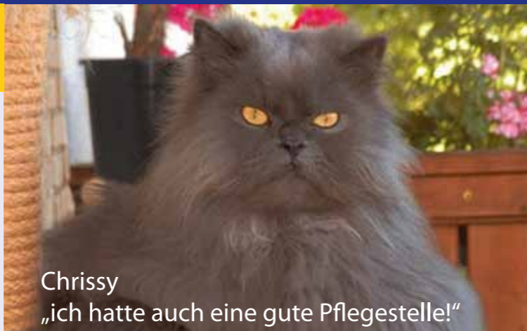
Chrissy „ich hatte auch eine gute Pflegestelle!“

Dank der Spenden, der Mitgliedsbeiträge und der Mithilfe aktiver und passiver Vereinsmitglieder hat sich der Verein gut entwickelt und viel Gutes getan sowie viel Leid gelindert!